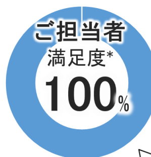
図2 企業担当者満足度(n=31)

*いずれも施策満足度5段階中TOP2(満足・やや満足)の回答割合(回答はサービス提供者全員ではありません)