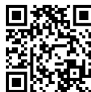
TANO-LT 問合せ先 2次元バーコード