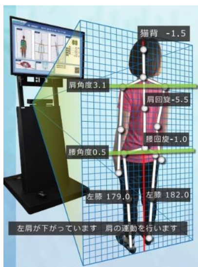
図1 TANOのセンシング概要

画面に表示された「健口眠体操」の動きを真似すると、センサーが骨格を読み取り、正しい動きと照らし合わせて骨格の一致率を点数化し、リアルタイムに表示します。これにより、自分の点数を上げる努力のきっかけを作ったり、他の人と競い合ったりなど、ゲーム感覚で体操を行うことができます。楽しくトレーニングを続けられることで、加齢により心身が老い衰える“フレイル”の予防を期待できます。