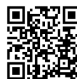
健口眠体操の動画 （ダイジェスト版） 2次元バーコード

そこでこのたび、「TANO」に「健口眠体操」のバーチャルゲームプログラムを搭載した、介護